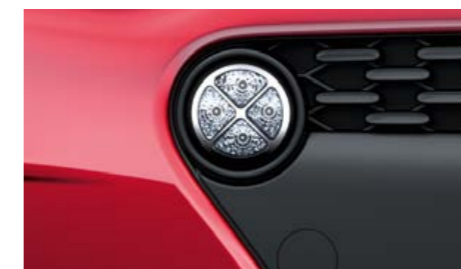
Luci diurne a LED Le nuove luci diurne rotonde a LED aggiungono un ulteriore tocco sportivo al muso della i10.