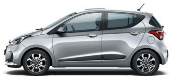
Sleek Silver (Metallizzato)