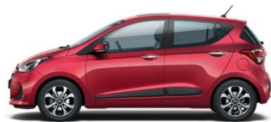
Passion Red (Micalizzato)