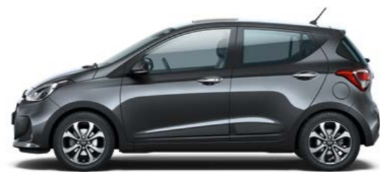
Star Dust (Metallizzato)