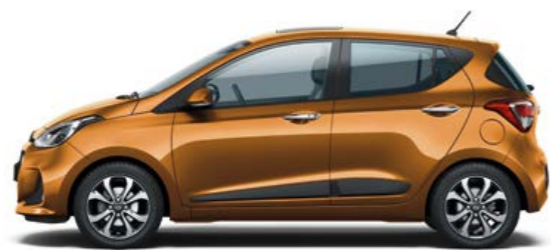
Mandarin Orange (Micalizzato)