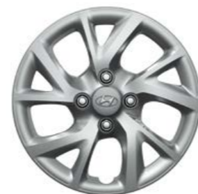
Copricerchi da 14" con design a 5 doppie razze metallic grey