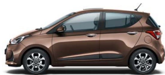
Cashmere Brown (Metallizzato)