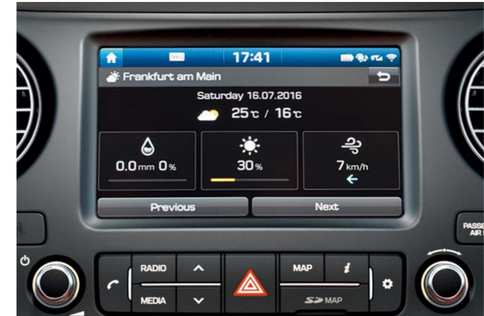
Navigatore con LIVE Services L'assistenza alla guida è completata da informazioni in tempo reale su traffico, presenza di autovelox**, condizioni meteo e dalle indicazioni sui luoghi di maggior interesse.

La connettività avanzata costituisce solo una delle particolarità che collocano Hyundai i10 al top della gamma. C'è il nuovo sistema di navigazione con LIVE Services e le nuove connessioni Apple CarPlay™* per iPhone e Android Auto™** per gli smartphone Android che ti permettono di avere sul display di i10 le principali funzioni del tuo smartphone. Così puoi sempre essere informato e connesso, senza distrarti dalla guida e dalla strada.