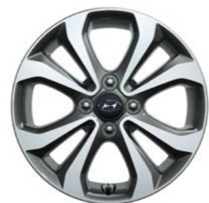
Cerchi in lega da 15" con design a 4 doppie razze metallic grey