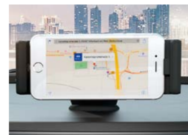
Smartphone docking station Il perfetto alloggiamento per reggere il tuo smartphone anche quando è in carica e continuare a navigare o ascoltare la tua musica.