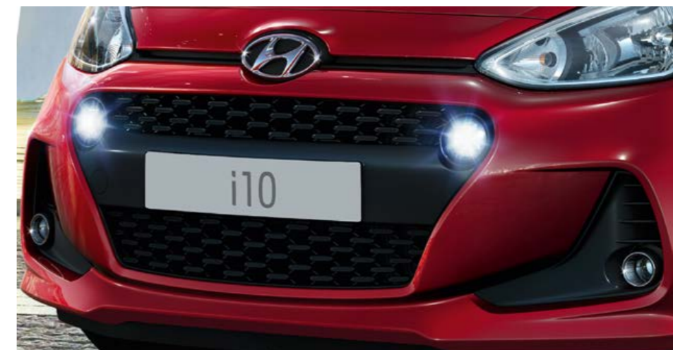
Cascading Grille La particolare forma della nuova Cascading Grille enfatizza il carattere deciso della i10.

Abbiamo dato allo stile e al design della nuova i10 un look sportivo che attira l'attenzione. Nel frontale spicca il paraurti anteriore scolpito che include la nuova Cascading Grille e le luci diurne di forma circolare a LED. Il nuovo design dei cerchi, il paraurti posteriore con inserti neri e le luci posteriori ridisegnate completano il quadro.