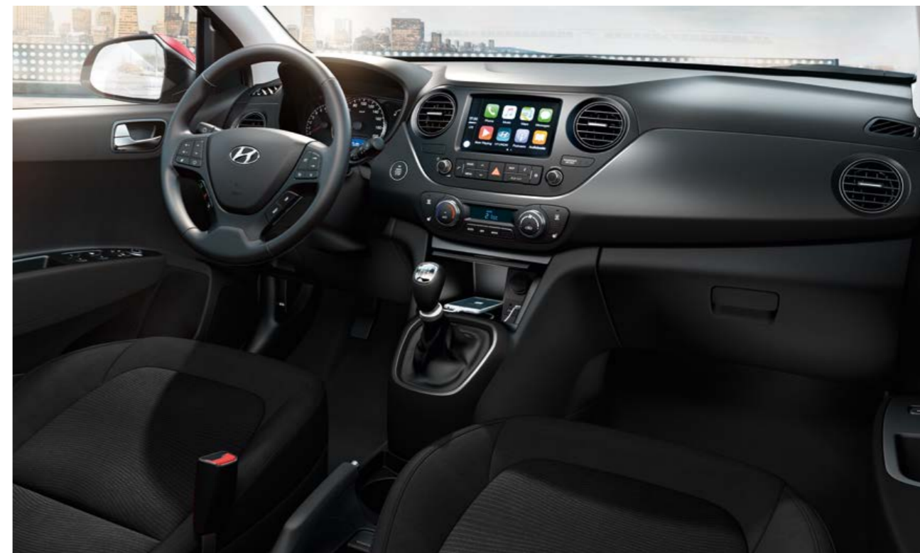
Black and Dark Grey