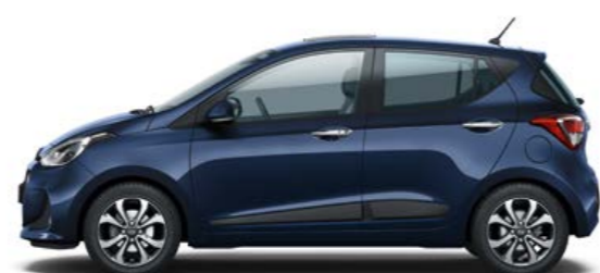
Morning Blue (Pastello)