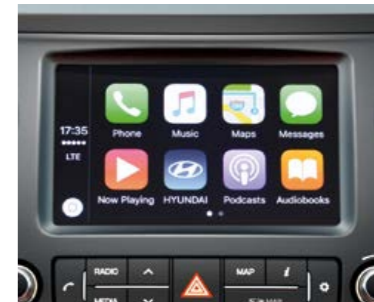
Apple CarPlay™ e Android Auto™ Mentre guidi, lo schermo touch-screen da 7" ti consente di sfruttare nel modo più sicuro il potenziale del tuo iPhone o degli smartphone Android compatibili.