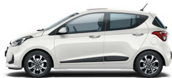
Polar White (Pastello)

Combina i tuoi colori, cerchi e tessuti preferiti per dar vita alla tua i10 ideale.