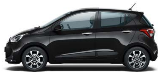
Phantom Black (Micalizzato)