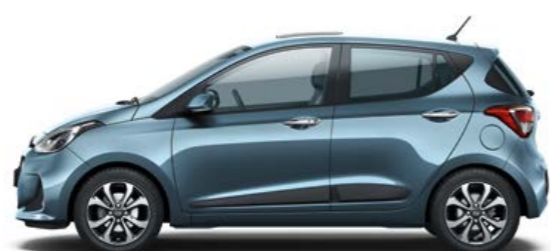
Aqua Sparkling (Metallizzato)