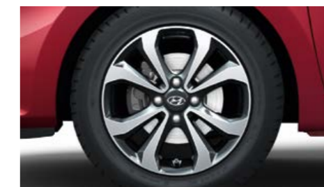
Nuovi cerchi I cerchi sono disponibili in due diversi design: tra questi i cerchi sportivi in lega da 15" in perfetta sintonia con il look accattivante della nuova i10.